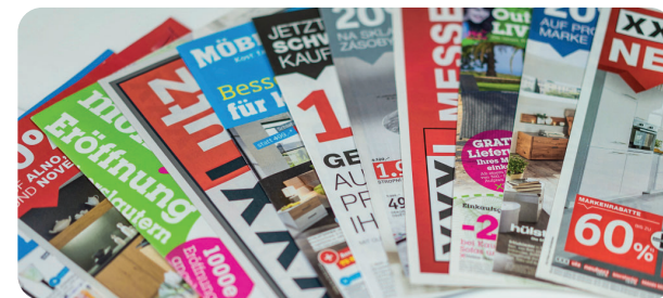
Maßgeschneiderte Softwarelösung für die Flugblatt-Produktion.

Die Grob- und Feinplanung der Kampagnen wird nun in der Kampagnen-Management-Lösung systemgestützt und, wo es geht, automatisiert durchgeführt. Mit einem ausgeklügelten Rechte- und Rollenkonzept wurden die Verantwortungen systemgestützt definiert und das erklärte Ziel, einen effizienten und fehlerfreien Produktionsprozess zu etablieren, erreicht. Die Vorteile des medienbruchfreien Arbeitens haben überzeugt, so dass die Lösung von Premedia mittlerweile in vielen anderen Werbemittelproduktionen (Mailings, Inserate, Scheckhefte, Verpackungen, ...) eingesetzt wird.